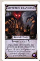
Carte Outre Monde

Les capacités et effets spéciaux qui s'appliquent aux cartes Aventure s'appliquent également aux cartes Outre Monde, mais seulement une fois qu'elles ont été piochées et placées sur le plateau.